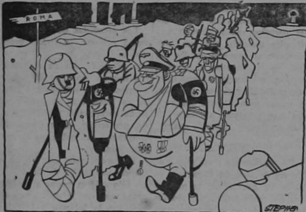
La segunda marcha sobre Roma