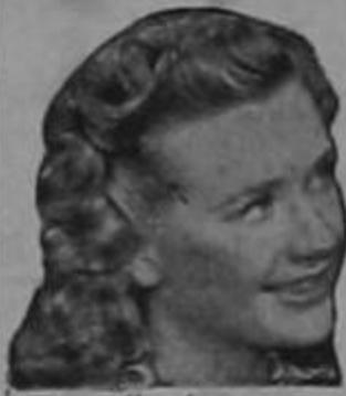
Priscilla Lane de la Warner Bros

DE VENTA EN TODAS LAS BOTICAS Y DROGUERIAS