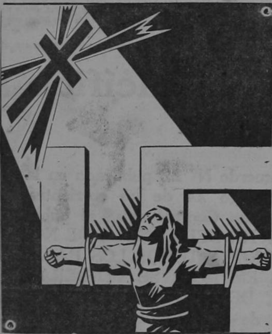
EL SIMBOLO DE LA LIBERTAD