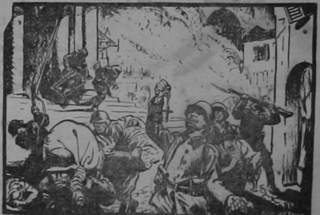
"Ciudad abierta" - Versión alemana

—No, señora — replicó el herido; — la herida es en la rodilla, pero se me corrió el vendaje.