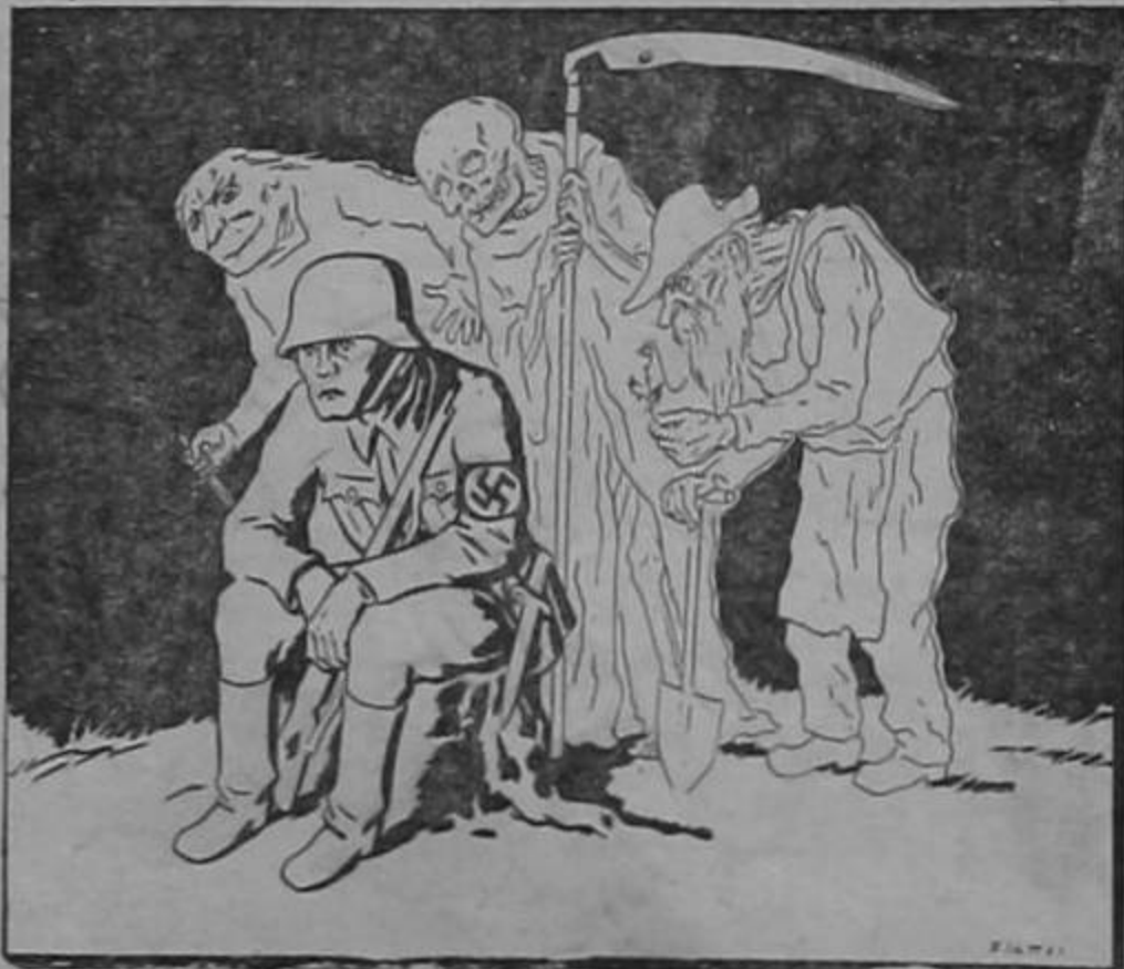
El odio, la muerte y el hambre, son sus compañeros