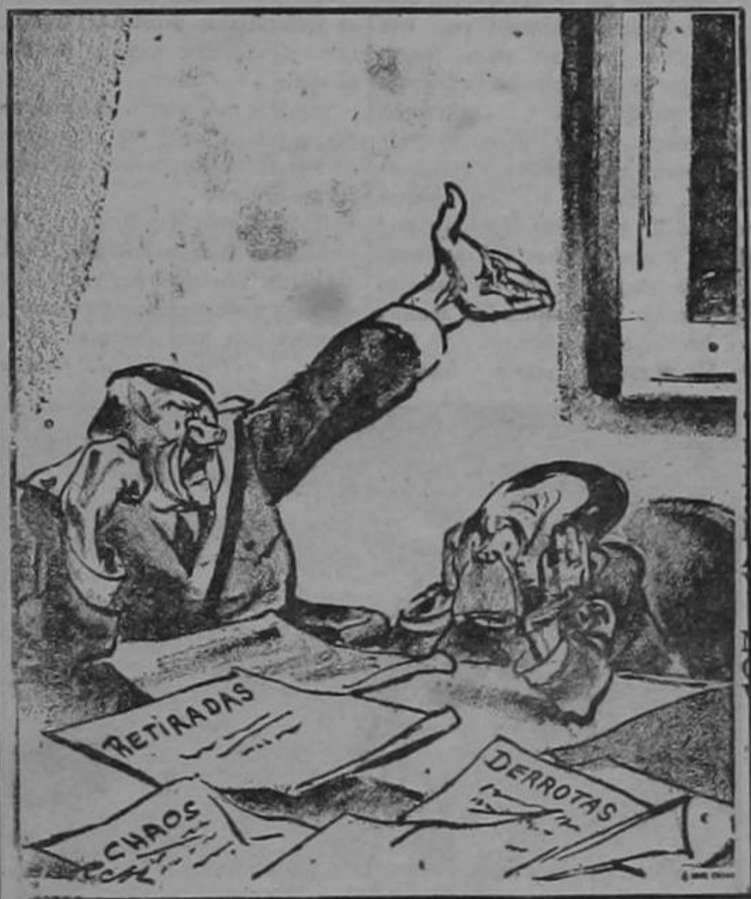
Hitler a Goebbels: "Podríamos echarle la culpa a los judíos... si nos quedase algún judío..."

Los atropellos al idioma constituyen un deporte del que abusan, sin escrúpulos, ciertas personas.