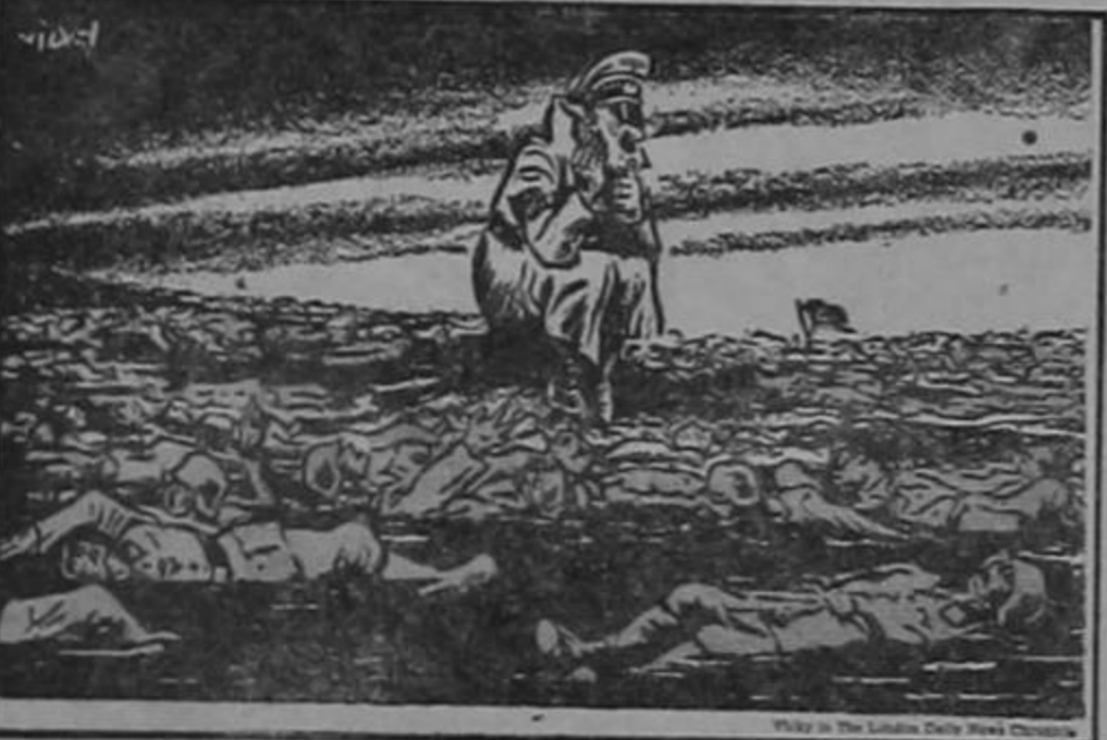
Hitler: "Si yo tuviera la Ucrania y Siberia, Alemania estaría en plena prosperidad..."